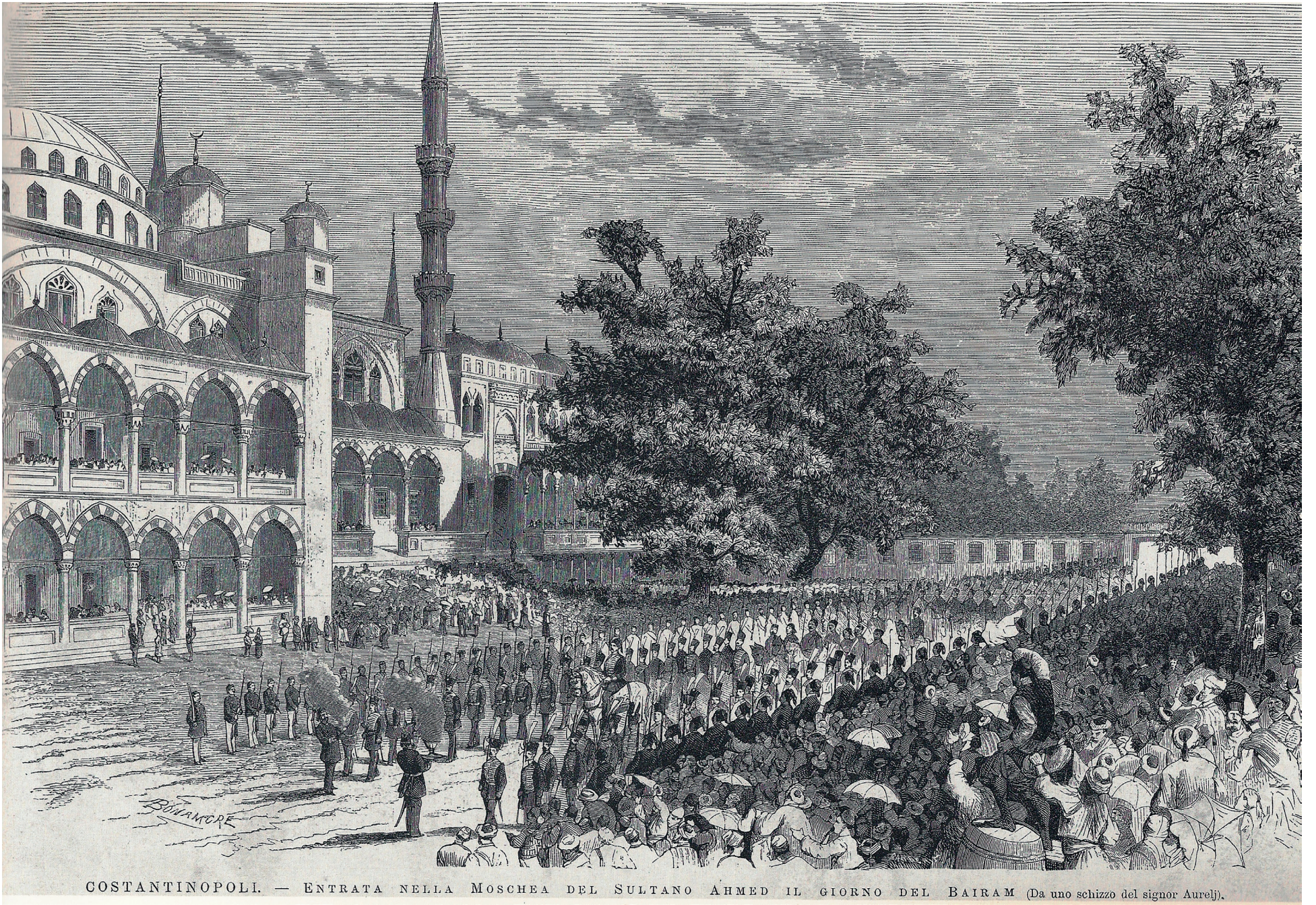
COSTANTINOPOLI. — ENTRATA NELLA MOSCHEA DEL SULTANO AHMED IL GIORNO DEL BAIRAM (Da uno schizzo del signor Aureli).